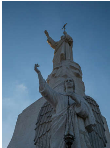
фото среди благоухающих бутонов и увидите другие красоты парка. Обещаем, вам не захочется покидать это великолепное место, но впереди — новые впечатления! За ними вы отправитесь в Ессентуки. Точнее, на Петропавловский холм, что находится вблизи курорта. Там располагается красивый храмовый комплекс с самой высокой в России статуей Иисуса Христа. Беломраморный Спаситель высотой в 22 метра ошеломляет величием и вызывает трепет. Недаром это место называют «Рио-де-Кавказ». После визита к новой православной святыне мы доставим вас на ужин и отдых в гостиницу Пятигорска. Обед будет на маршруте.